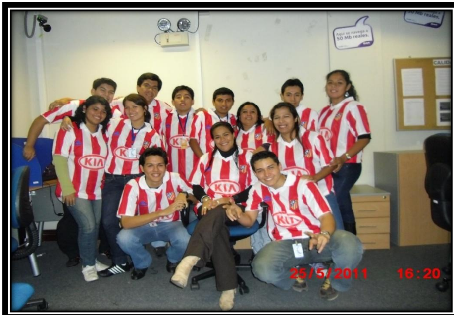
Figura # 3 Año: 2011-2016